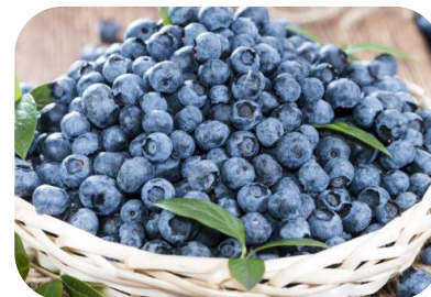
marjad (mustikad) 45%