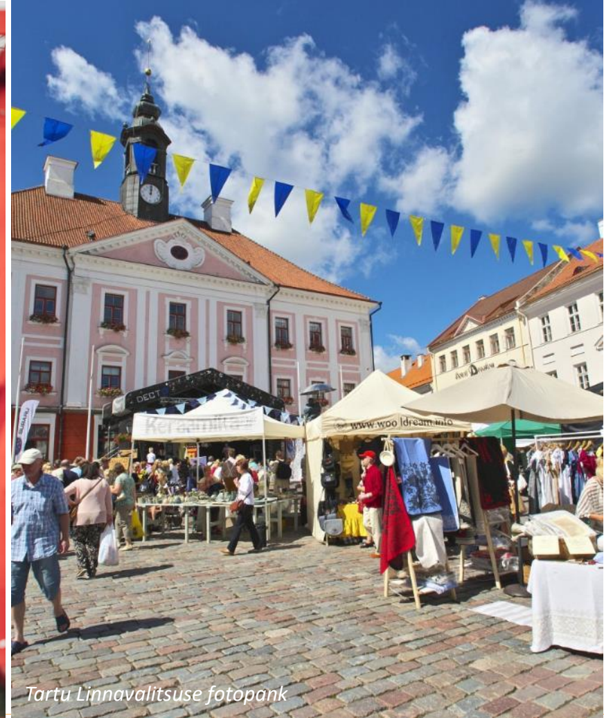
Tartu Linnavalitsuse fotopank